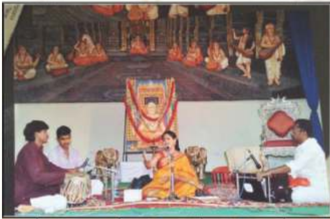
ಶ್ರೀ ರಾಘವೇಂದ್ರಸ್ವಾಮಿಗಳ ಆರಾಧನೋತ್ಸವ, ಮಂತ್ರಾಲಯ.