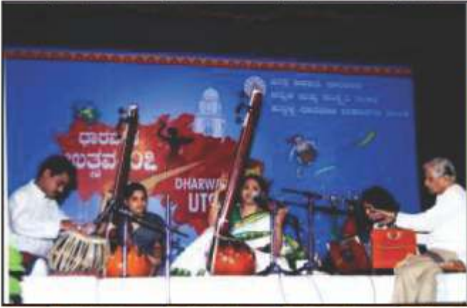
ಧಾರವಾಡ ಬಿಲ್ಲಾ ಉತ್ಸವ 2007