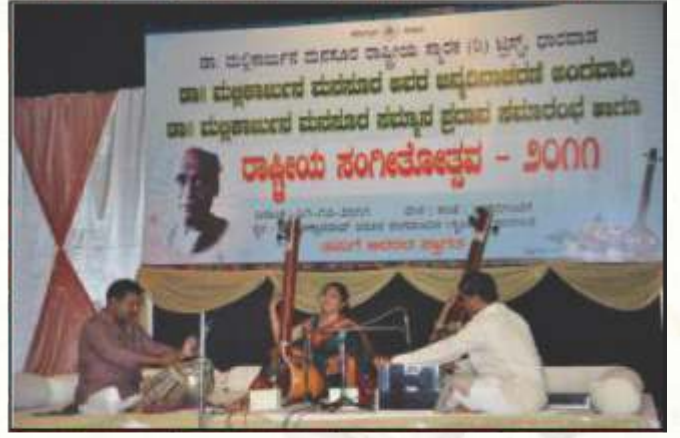
ಡಾ. ಮಲ್ಲಿಕಾರ್ಜುನ ಮನ್ಸೂರ್ ರಾಷ್ಟ್ರೀಯ ಸಂಗೀತೋತ್ಸವ 2011