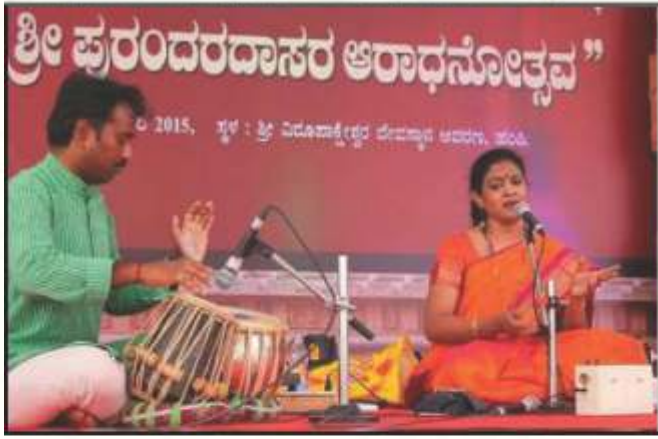
ಶ್ರೀ ಪುರಂದರದಾಸರ ಆರಾಧನೋತ್ಸವ, ಪಂಚಿ, 2015.