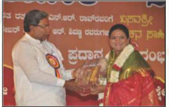
ಮುಖ್ಯಮಂತ್ರಿ ಸಿದ್ಧರಾಮಯ್ಯನವರಿಂದ ಸನ್ಮಾನ ಸ್ವೀಕಾರ.