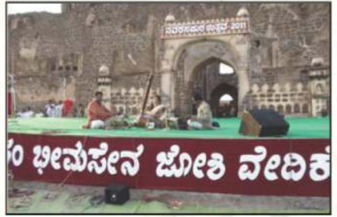
ನವರಸಪುರ ಉತ್ಸವ, ವಿಜಯಪುರ, 2011.