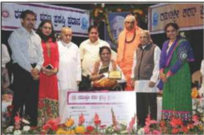
ರಮಣಶ್ರೀ ಪದಾಧಿಕಾರಿ ಉತ್ತರೇಷನ ಪ್ರಶಸ್ತಿ ಸ್ವೀಕಾರ 2014.