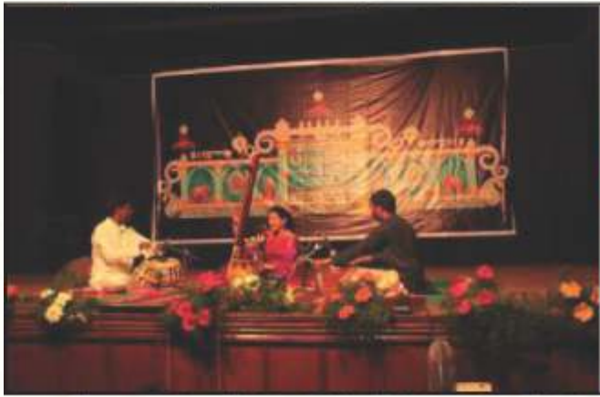
ದಸರಾ ಉತ್ಸವ, ಮೈಸೂರು 2013.