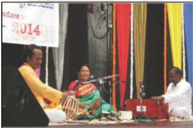
ಬಸವ ಜಯಂತಿ ಸಂಗೀತೋತ್ಸವ, ಮುಂಬಯಿ, 2014.