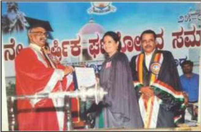
ಕರ್ನಾಟಕ ವಿಶ್ವವಿದ್ಯಾಲಯದಿಂದ ಪಿ.ಹೆಚ್.ಡಿ. ಪದವಿ ಸ್ವೀಕಾರ.