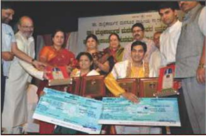
ಡಾ. ಮಲ್ಲಿಕಾರ್ಜುನ ಮನ್ಸೂರ್ ರಾಷ್ಟ್ರೀಯ ಯುವ ಪುಸ್ತಕೋತ್ಸವ 2011