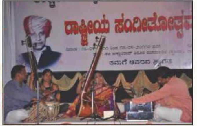
ಡಾ. ಬಸವರಾಜ ರಾಜಗುರು ರಾಷ್ಟ್ರೀಯ ಸಂಗೀತೋತ್ಸವ 2011