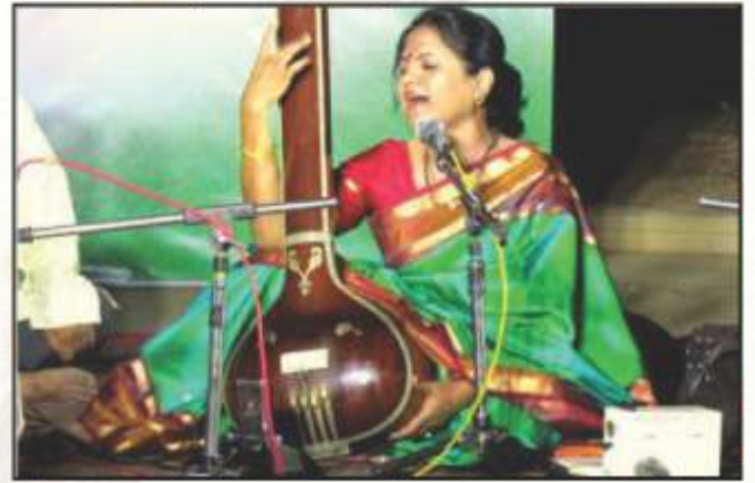
ಗೂಡಾಚೆಟ್ಟೋತ್ಸವ ಸಂಗೀತೋತ್ಸವ, ಬೆಂಗಳೂರು.