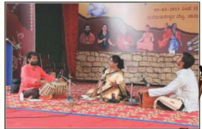
ವಚನ ಗಾಯನ, ಮಲೆಮಹಾದೇಶ್ವರ ಬೆಟ್ಟ, 2013.