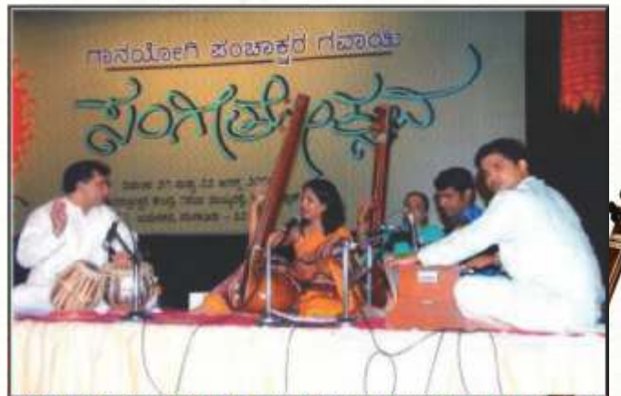
ಗಾನಯೋಗಿ ಪಂಚಾಕ್ಷರಿ ಗವಾಯಿ ಸಂಗೀತೋತ್ಸವ, ಬೆಂಗಳೂರು